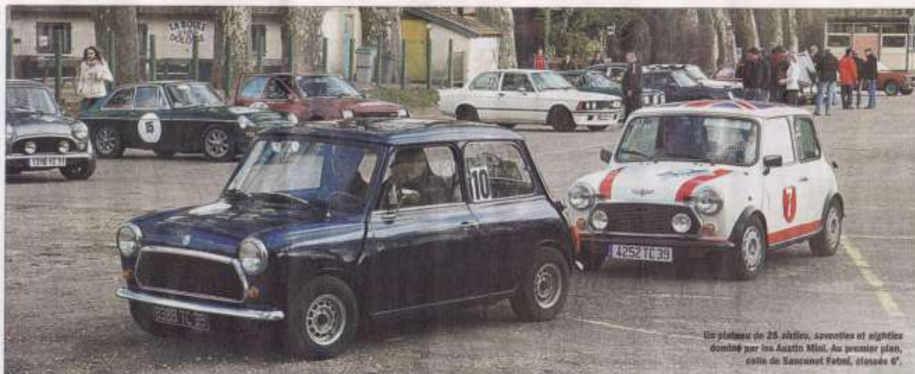
Un plateau de 25 étoiles, Aventures et nighties contre les Austin Mini. Au premier plan, celle de Sanceret Fafni, classée 6 e .