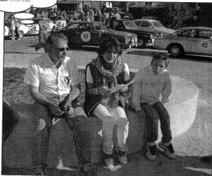
Routes du Jura 2003